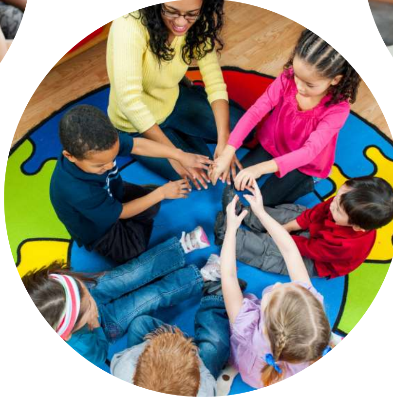
Sosyal ve Duygusal Gelişim