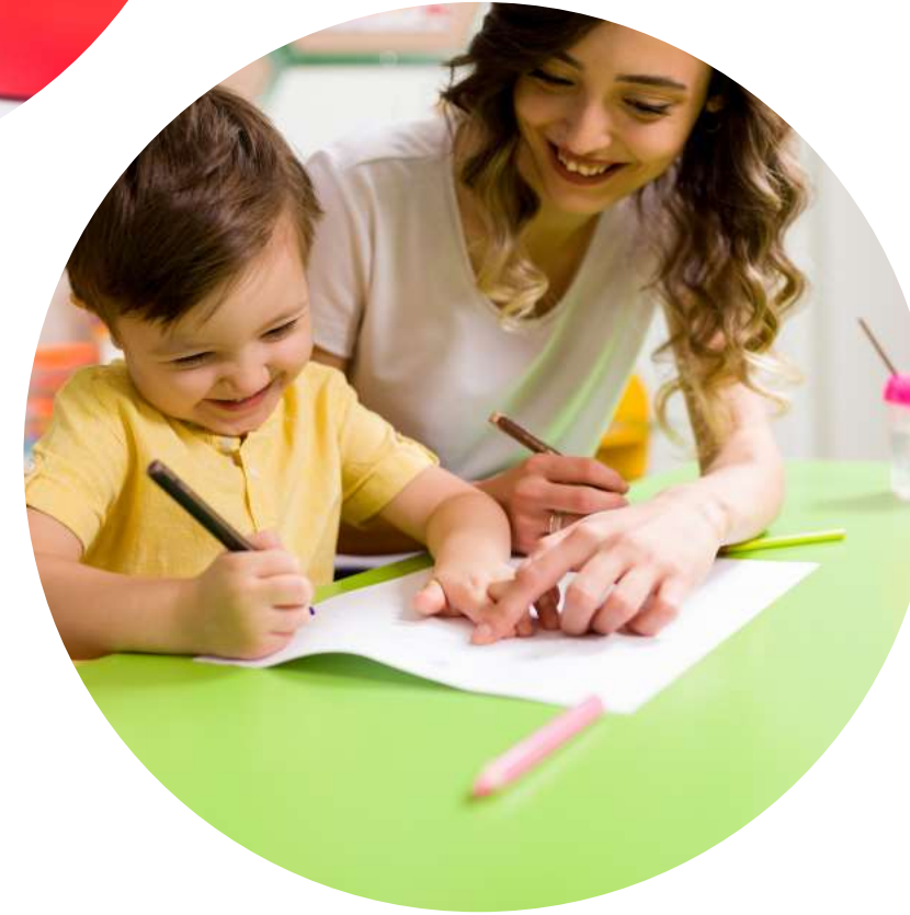
Okuma-Yazmaya Hazırlık Etkinlikleri