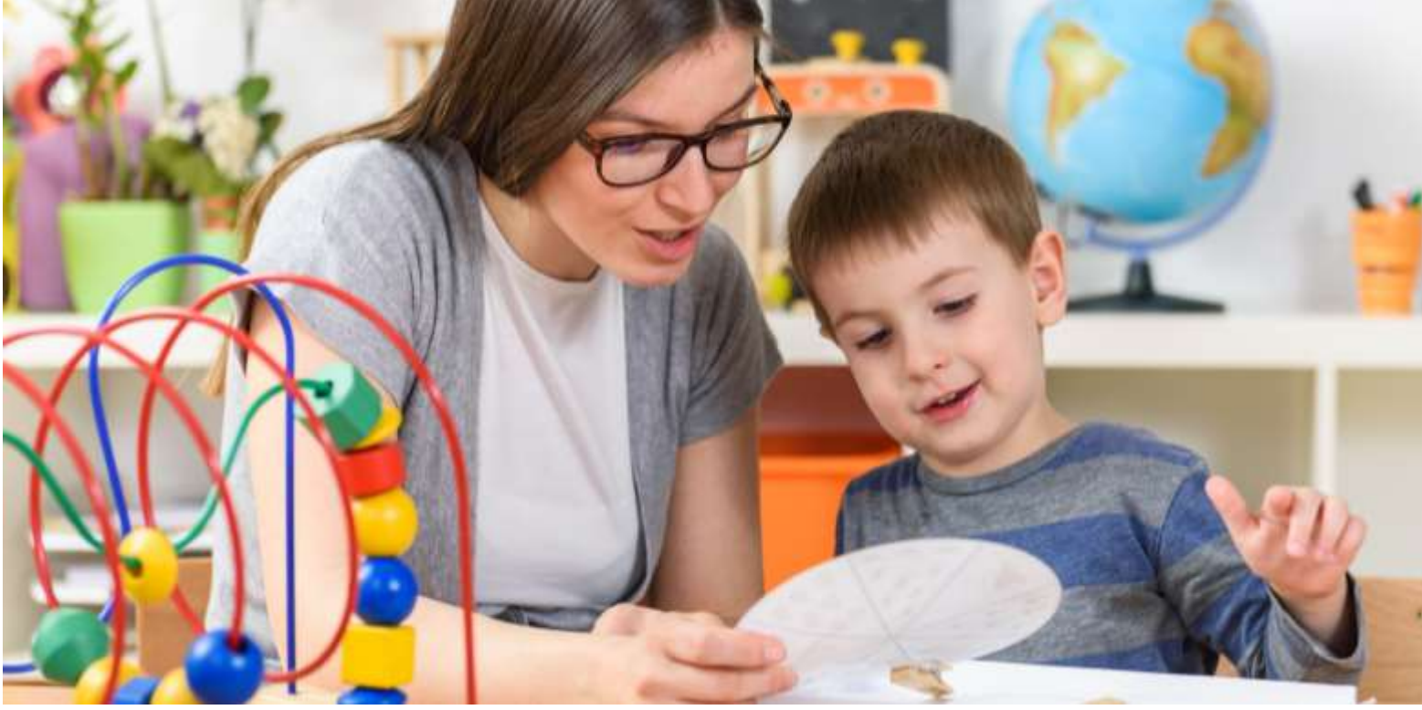
Yeni bir öğretmen