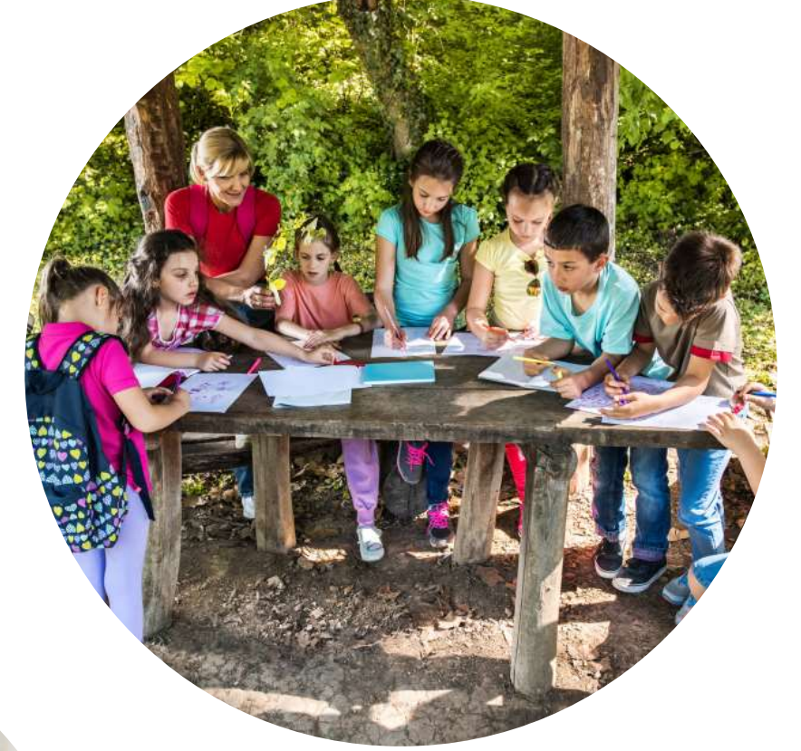
Açık Hava Etkinlikleri